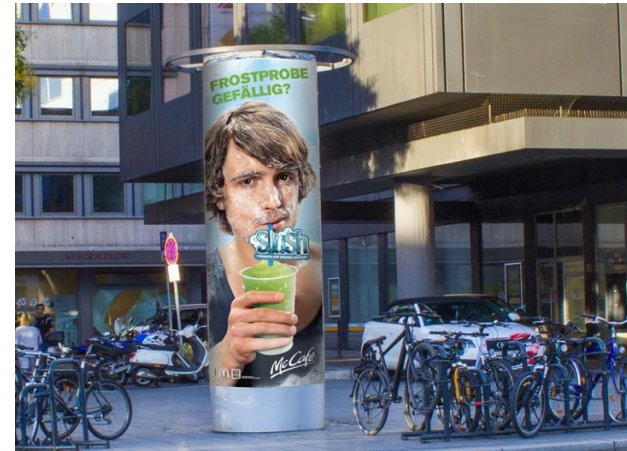
Beispiel 8/I -Ganzsäule